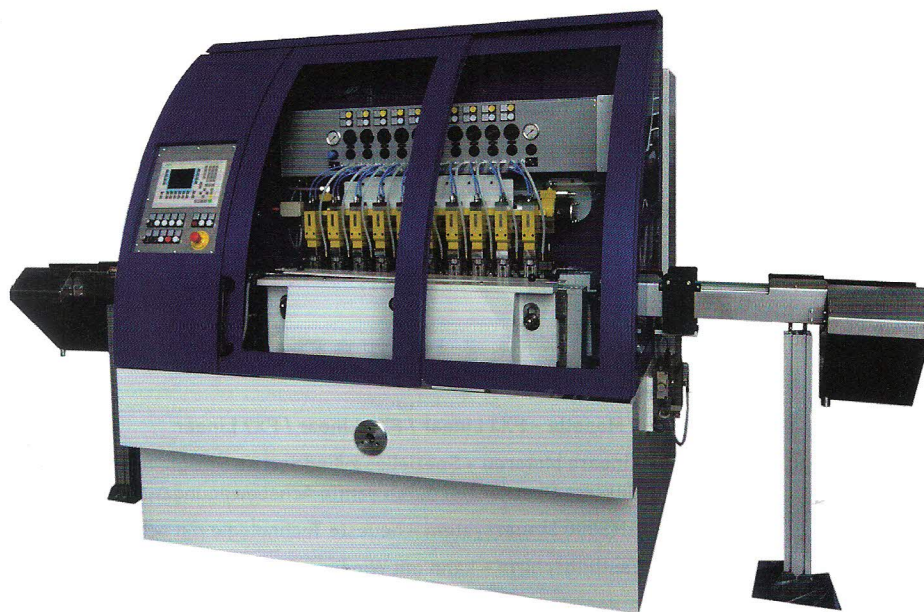
Bild 1: Die VarioFin von Nagel ist eine spitzenlose Superfinish-Durchlaufmaschine, die z.B. für die Fertigbearbeitung von Kolbenstangen, Kolbenbolzen, Nadeln, Hülsen, Zylinderrollen oder Kegelrollen zum Einsatz kommt. Ihr modularer Aufbau macht sie zu einer flexiblen Lösung für unterschiedliche Aufgaben. Die Maschine wird künftig mit neuen, verdrehgesicherten Steinführungen und integriertem Wegemesssystem für die Verschleißerkennung der Schneidmittel ausgeliefert